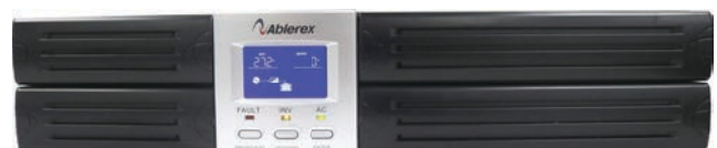
Visto de frente